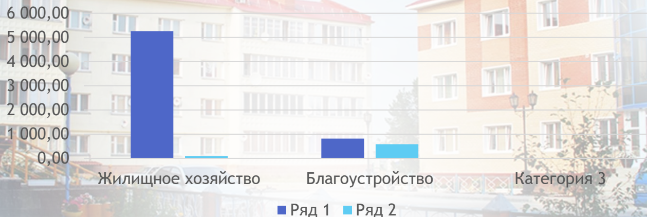
Объем исполнения, тыс.рублей